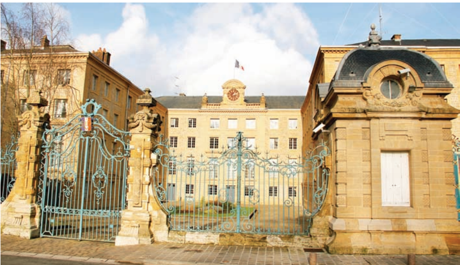
Illustration 4 : l'École du génie de Mézières

Photographie du colonel Dardonville (1948) de la porte d'Arches qui abrite l'École du génie entre 1748 et 1753, puis sert à divers enseignements en annexe de l'Hôtel du Gouvernement puis de la nouvelle école de 1753 à 1793 (BCXRH, X2b/443 : Colonel Dardonville, L'école royale du génie de Mézières, 1748-1948 , fascicule).