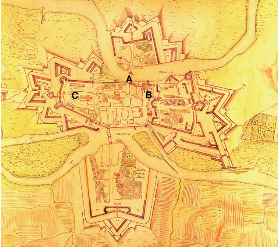
Illustration 2 : plan de Mézières (1748)

Mézières, 1748, 1ère feuille. Dupont (copie Erker), 1747 (copie 1948), 395 x 605mm (435x650/475x615mm), couleurs, 150 toises, AD Ardennes 1 fi 610.