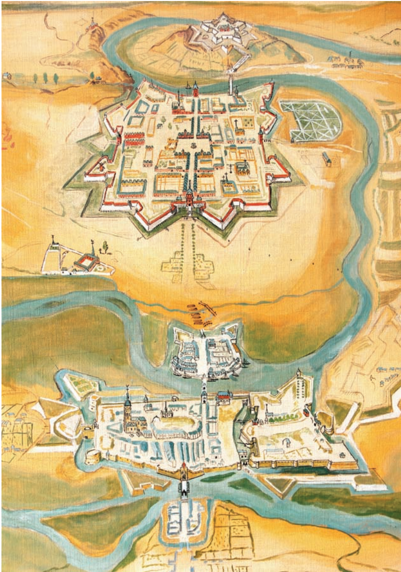
Illustration. 1 - Charleville, Mézières et leurs environs à la fin du XVII e siècle

aux questions spatiales invite l'historien d'un groupe élitare à interroger l'espace sur lequel la domination symbolique ou réelle du groupe s'appuie et se diffuse 19 .