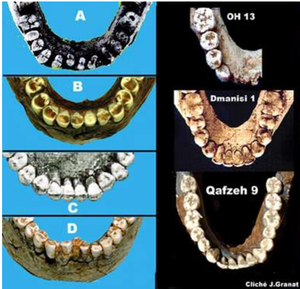
FIGURE2. — Usure des incisives et évolution. A gauche, mandibules néandertaliennes: A: La Ferrassie, B: Tabun, C: Regourdou, D: Amud. A droite, mandibules de la lignée 'moderne'

Incisive n.f.. Dérivé savant d' incision (1545, Paré, au pluriel), désigne chacune des dents de devant, aplatie et tranchante, qui sert à couper les aliments [A. REY – Le Robert Dictionnaire historique, 2000]